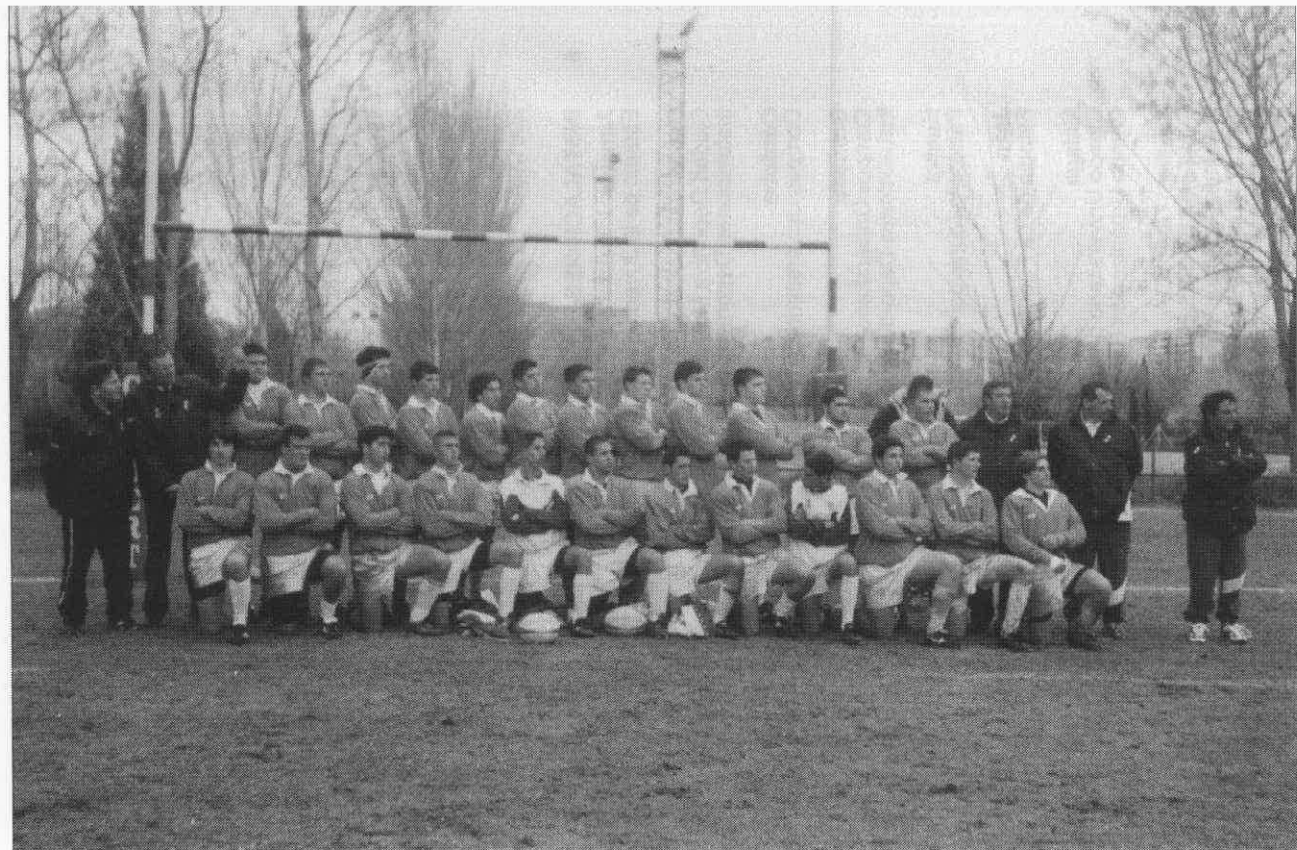
Selección Andaluza Cadete