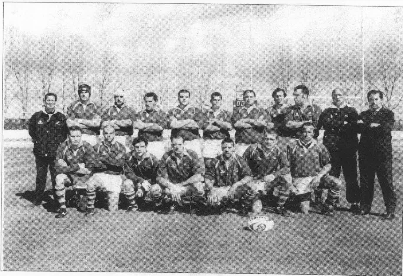
Universidad de Sevilla.