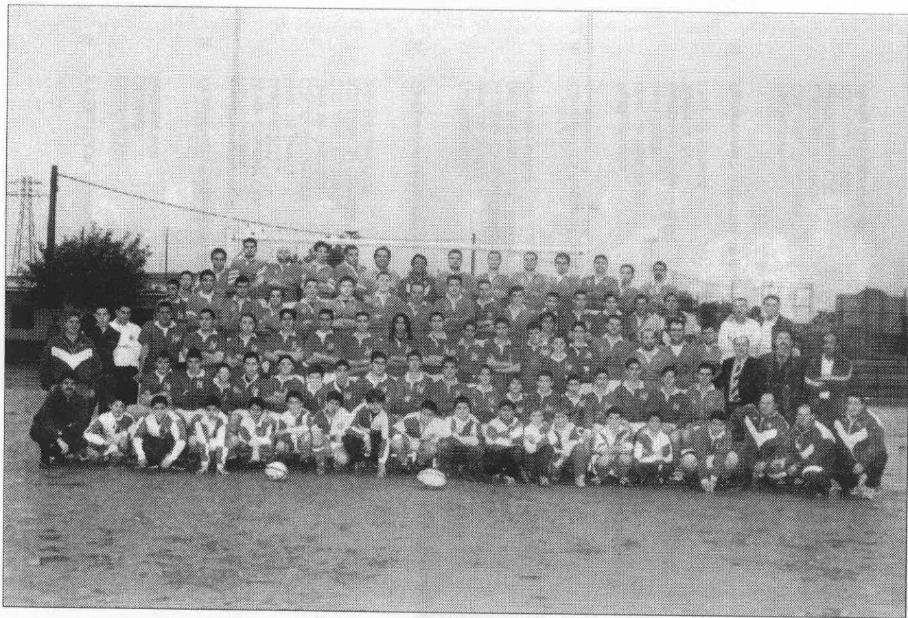
Club Dto. Macarena – E.R. San Jerónimo.