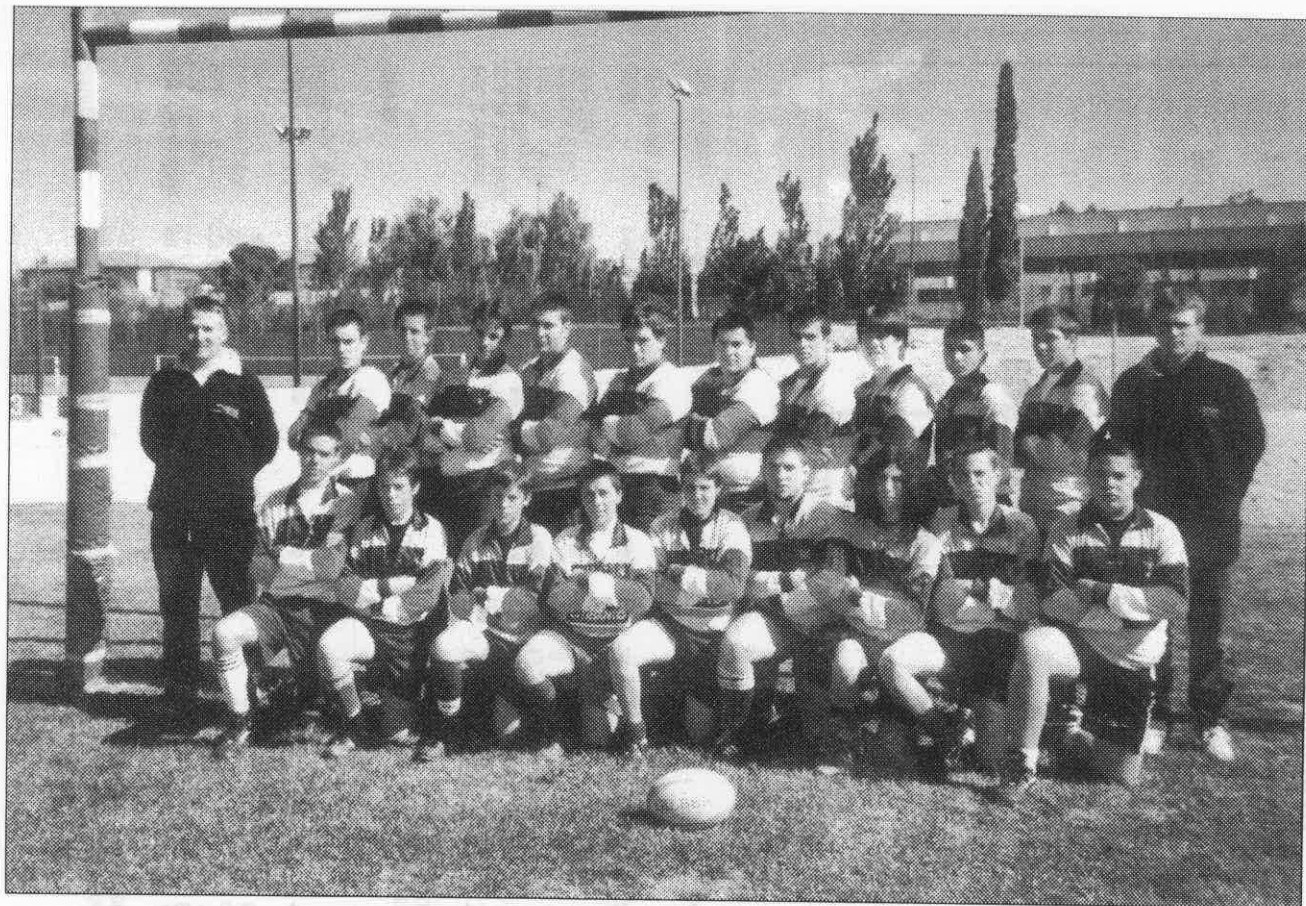
Fénix C.R. categoría cadete.