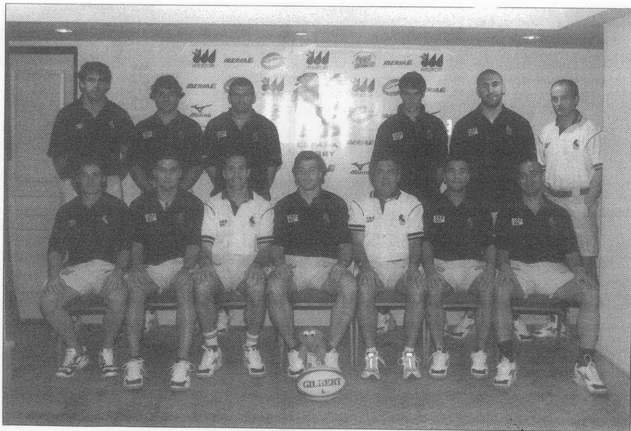
Selección Española de Rugby a 7. Copa del Mundo Sevens. Mar del Plata (Argentina). Del 21 al 28 de enero de 2001.