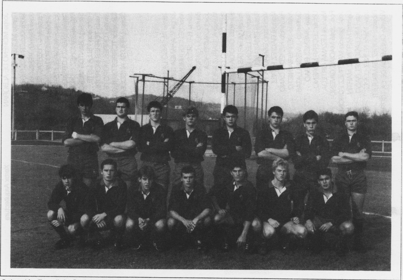
Selección Española Cadete contra Alemania. Irún, 30-XII-1990.