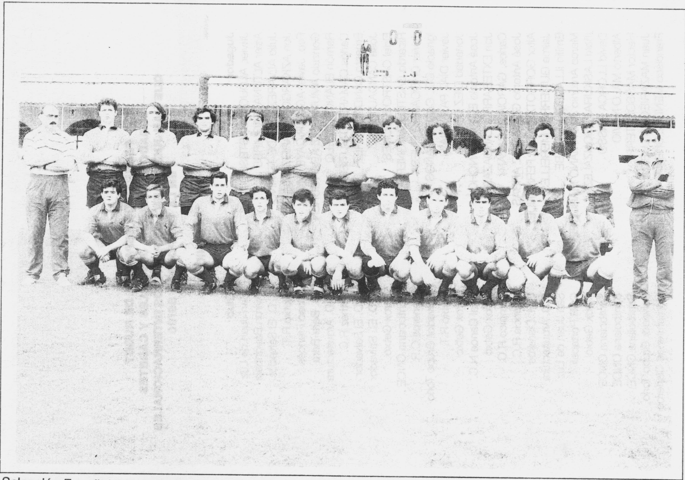
Selección Española Juvenil contra Escocia. Madrid, 28 -IV - 1991.