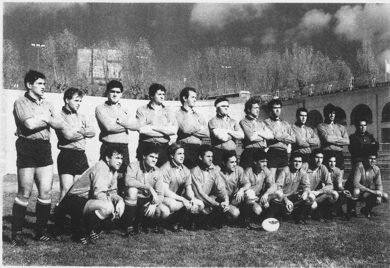
Selección Española contra Australia (Emerging). Madrid, 25 - XI - 1990.