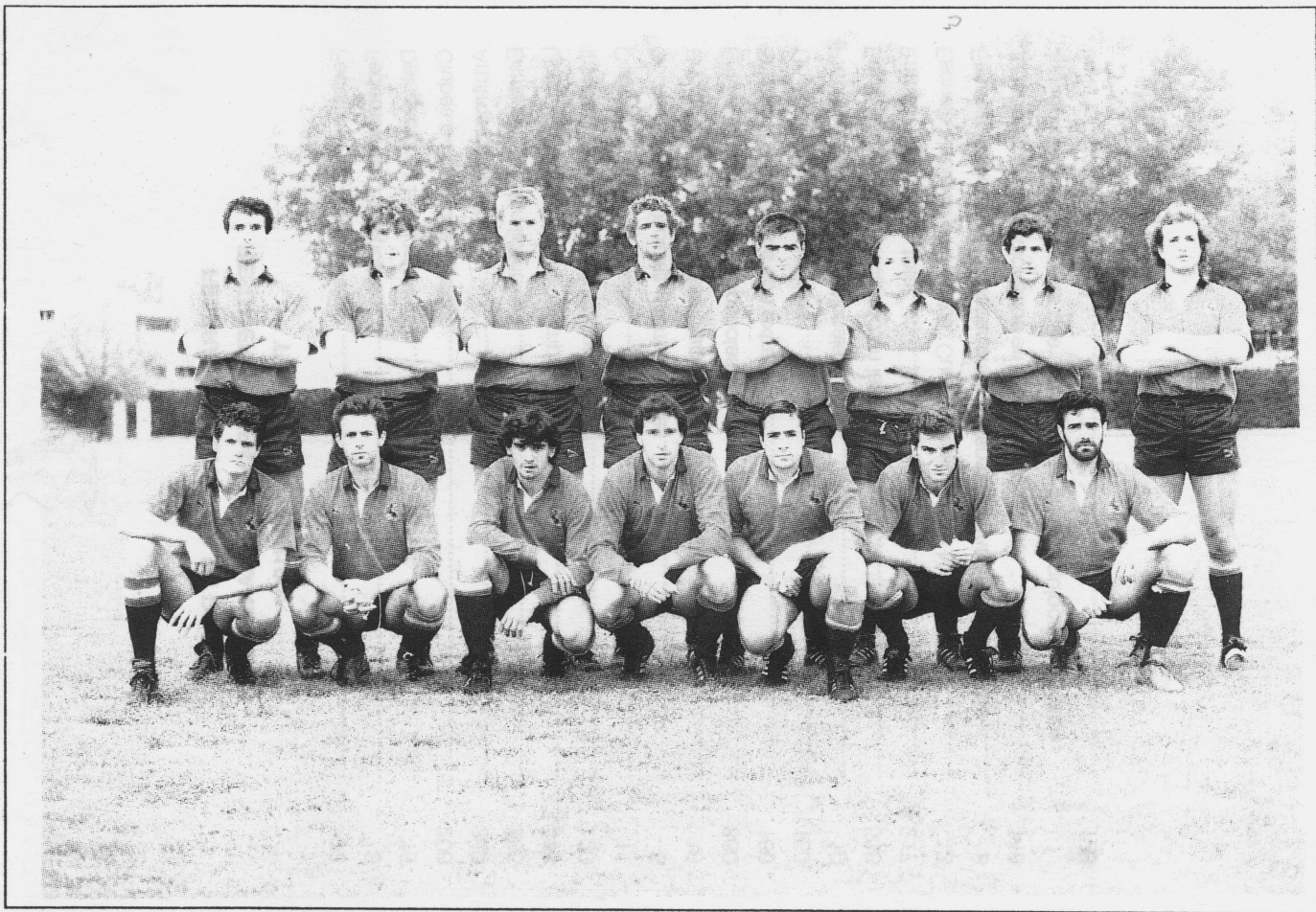
Selección Española contra Francia. Madrid, 28 abril 1991.