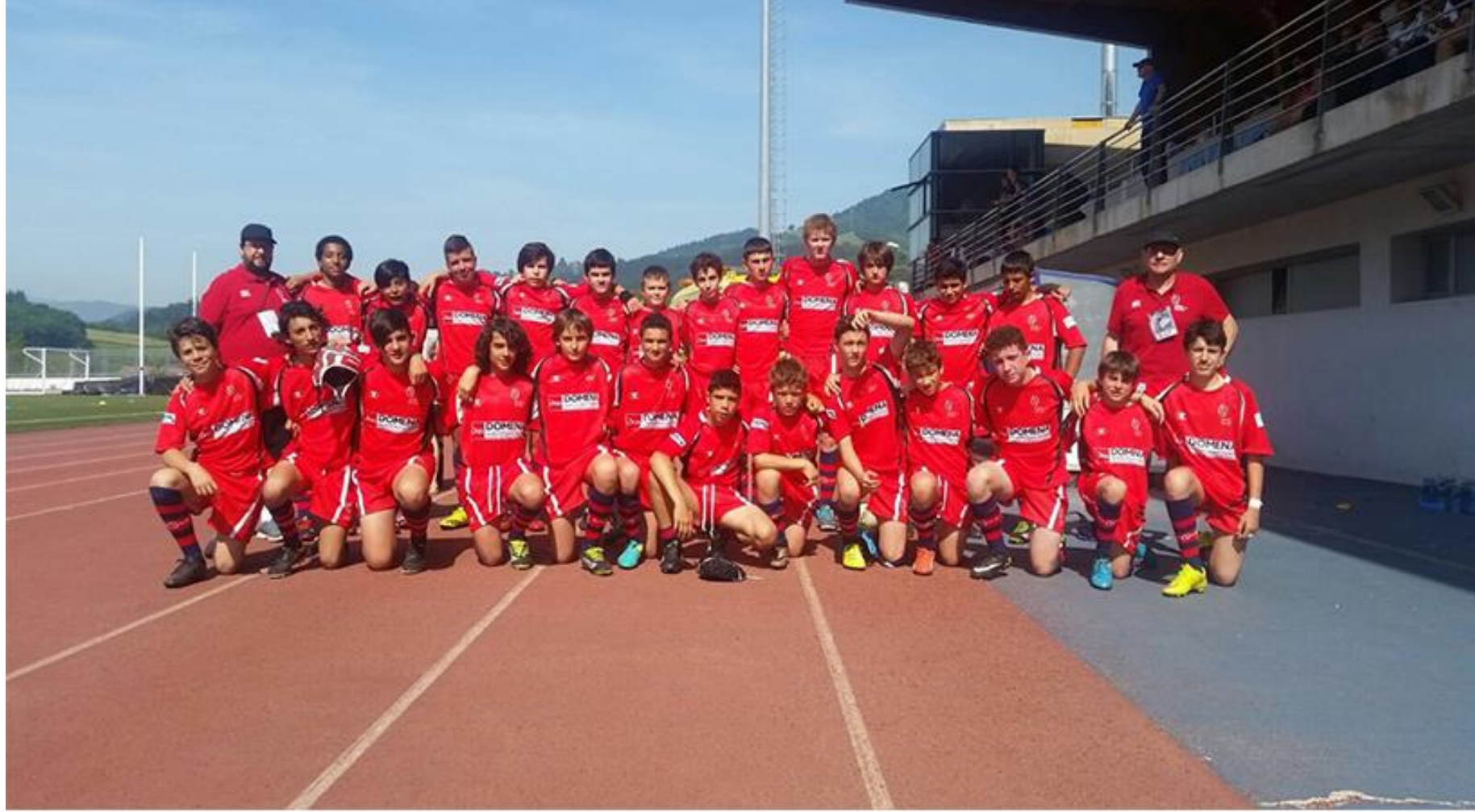
Selección Navarra Sub 14. Temporada 2016/17.