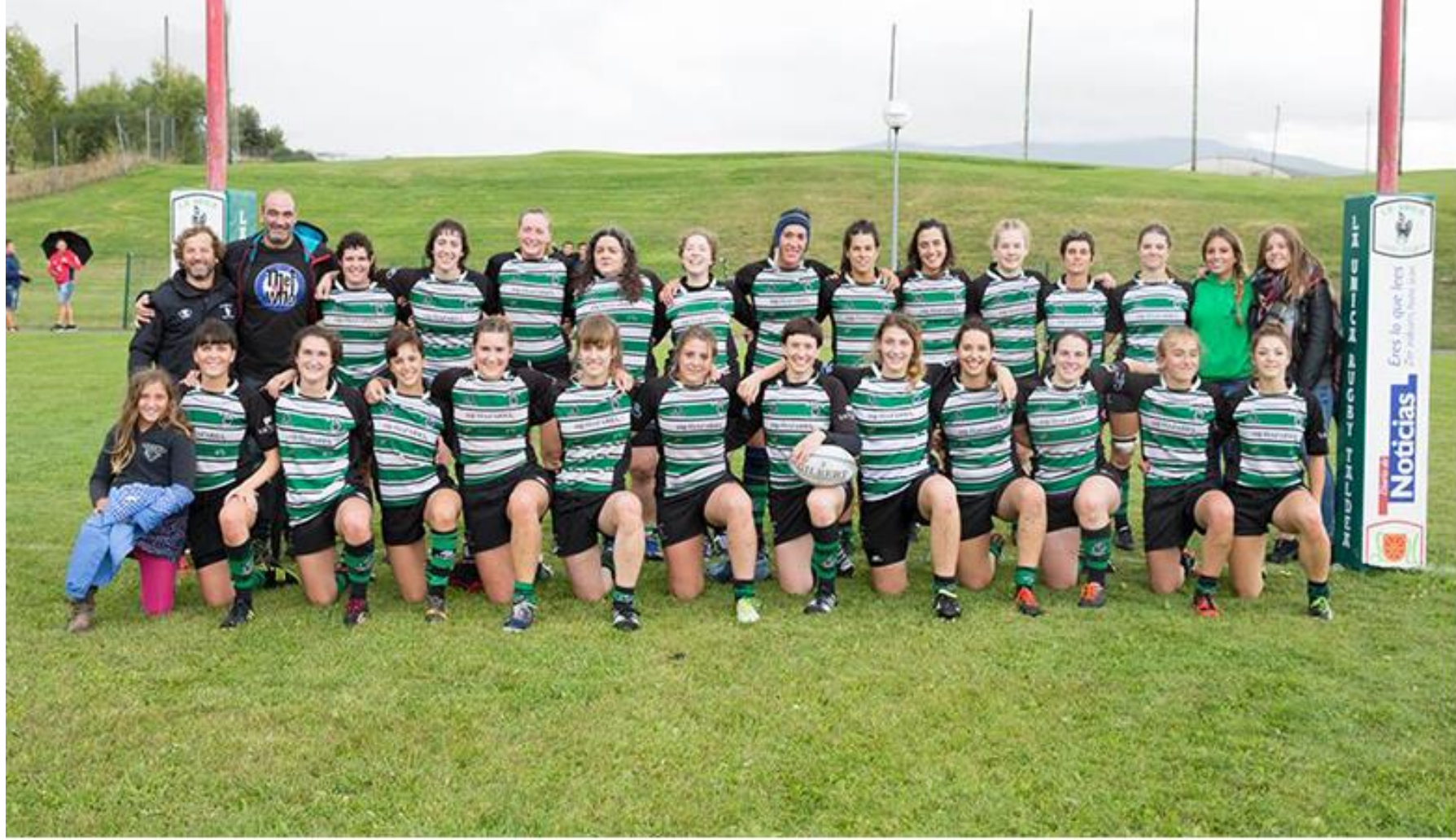
La Única R.T. Femenino. Temporada 2016/17.