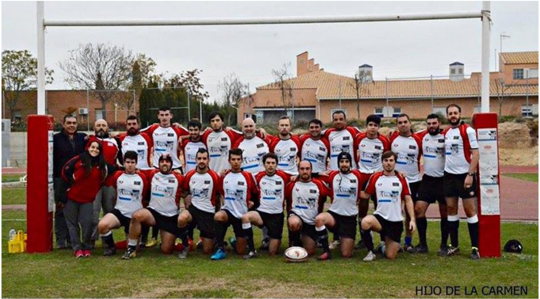
Gigantes Navarra Senior. Temporada 2016/17.