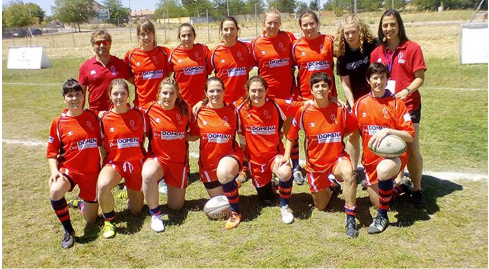
Selección Navarra Femenina Seven. Temporada 2016/17.