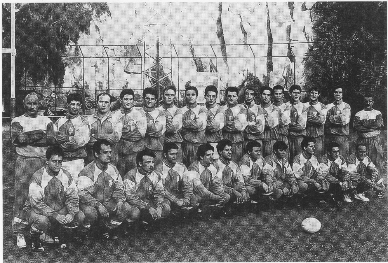
C. Natación Barcelona. Asciede a 1ª Nacional.