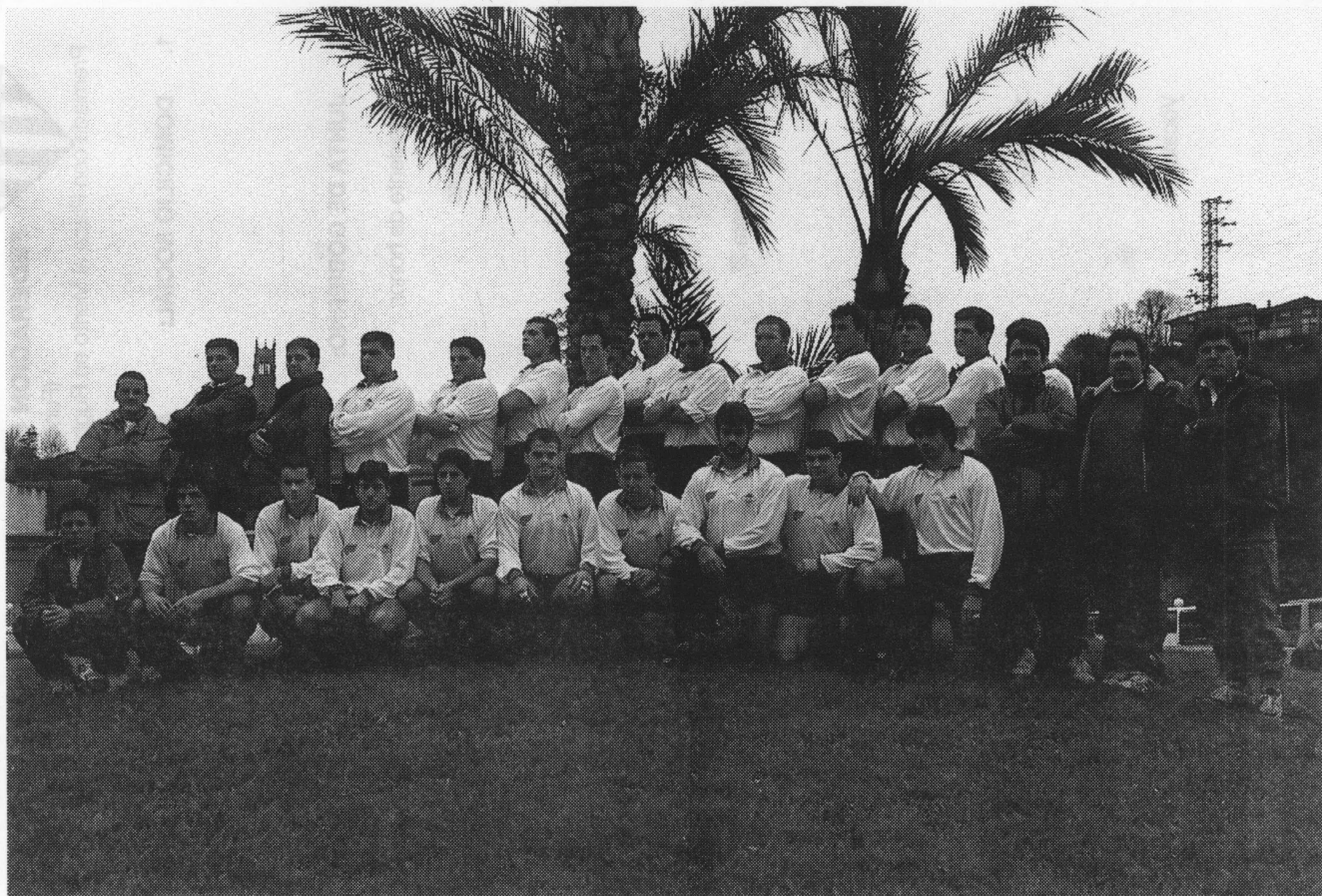
Selección Senior de Cataluña.