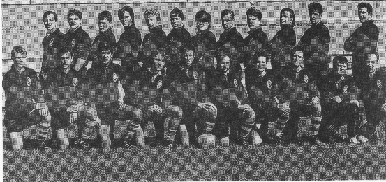
CR Reus Deportivo.

DEPOSITO Ctra VALENCIA km 245 * 43006 TARRAGONA Tel. 54 32 90