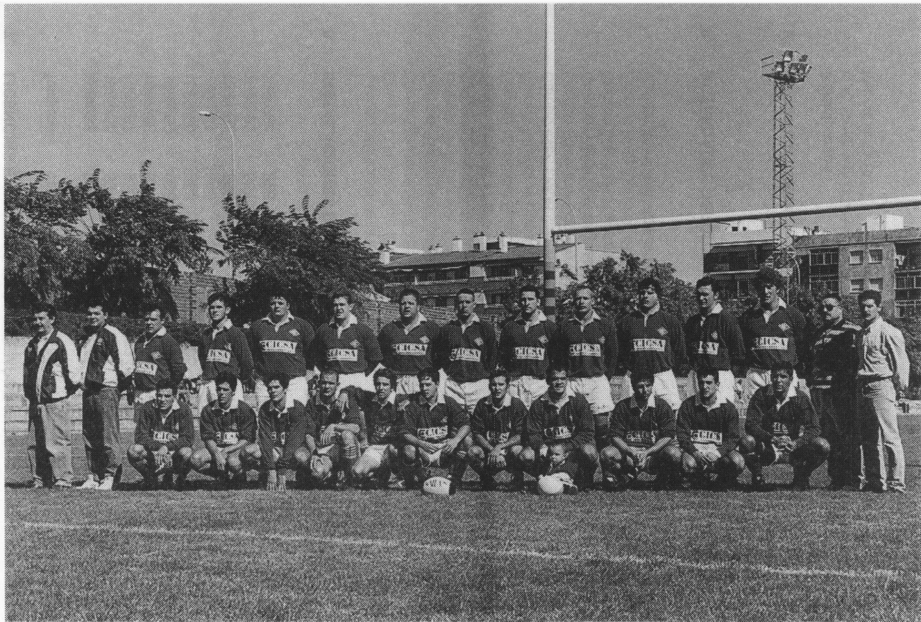
UE Santboiana / CICSA.