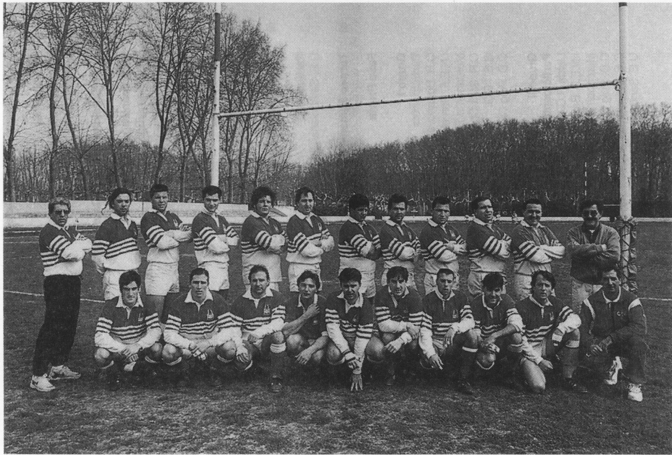
G. E. L. E. G.