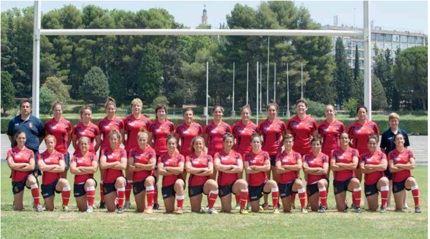
Selección Española Femenina de Rugby - Foto Oficial WRWC 2014

Se acaba el 2014 y es hora de hacer balance de lo que nos dejan 365 días de rugby en los que podemos destacar que este año pasará por ser el año del VRAC Quesos Entrepinares pero también lo será el de Olímpico de Pozuelo, el de nuestras Leonas mundialistas o el año en que perdimos la condición de “Core Team” en las Series Mundiales. Estos son algunos de los resultados que hemos obtenido en 2014, en caso de querer más información en nuestra web encontrarán esta noticia con hipervínculos a los resultados citados.