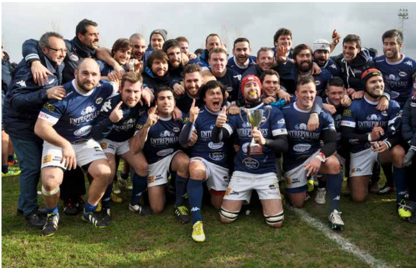
La plantilla del VRAC Quesos Entrepinares celebra el triunfo en la Copa Ibérica frente al CDUL el 28.12.2014.